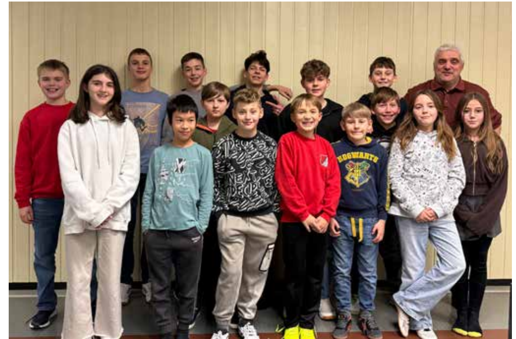
15 von aktuell 25 Nachwuchsspielern mit ihrem Trainer

Friedrich-Bergius-Ring 7 97076 Würzburg T. 0931-27 26 67 F. 0931-27 85 132 E. info@ziegler-shk.de www.ziegler-shk.de