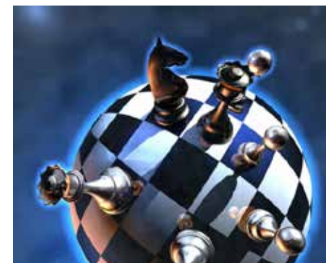
Schach rules the world