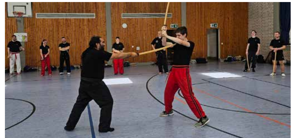
Demonstration mit dem Holzsword (Bokken)