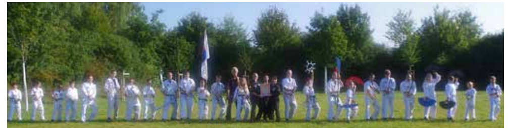
Trainer, Gäste und Organisatoren