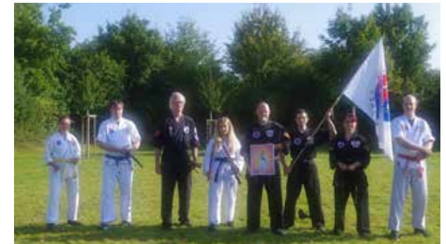
Trainingszeltlager der K.S.M.A.-Organisation 2021