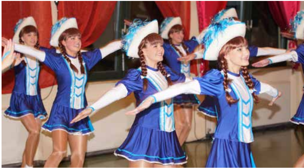
Marschtanz der Juniorengarde