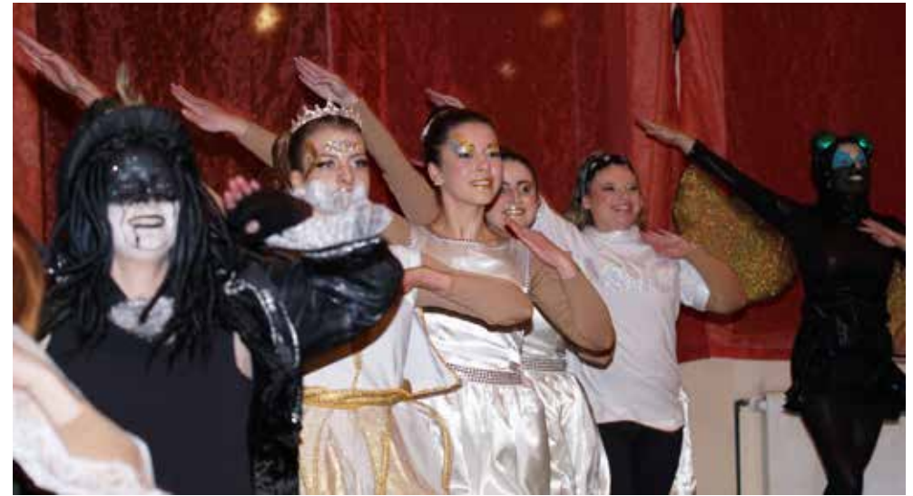
Schautanz der Aktivengarde