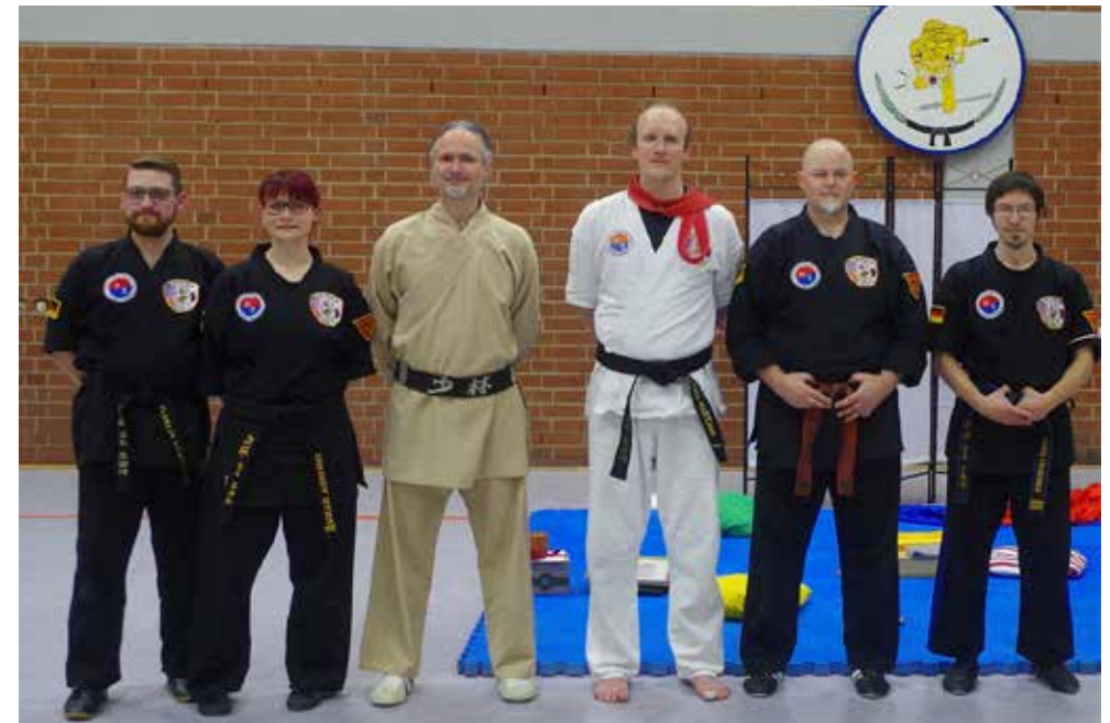
Prüfling (3. v. rechts) und Mitglieder der Prüfungskommission

Tauberbischofsheim Marktplatz 7 97941 Tauberbischofsheim Tel: 09341 846 87-0