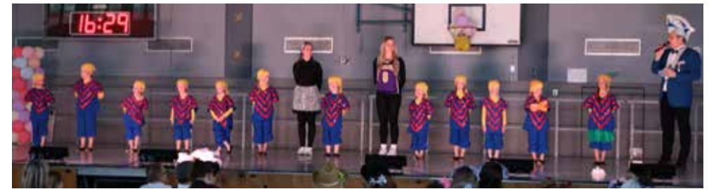
Tanz der Lemmetraterli