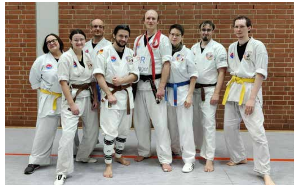
Nach getaner Arbeit: Der frisch gekürte Schwarzgurt und sein Prüfungsteam