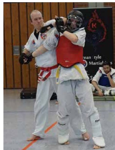
Demonstration von Verteidigungstechniken gegen Angriffe mit Waffen, hier: Schwert

Unsere Trainingszeiten sind regulär dienstags von 20:30 Uhr bis 22:00 Uhr im Manfred-Stahl-Raum.